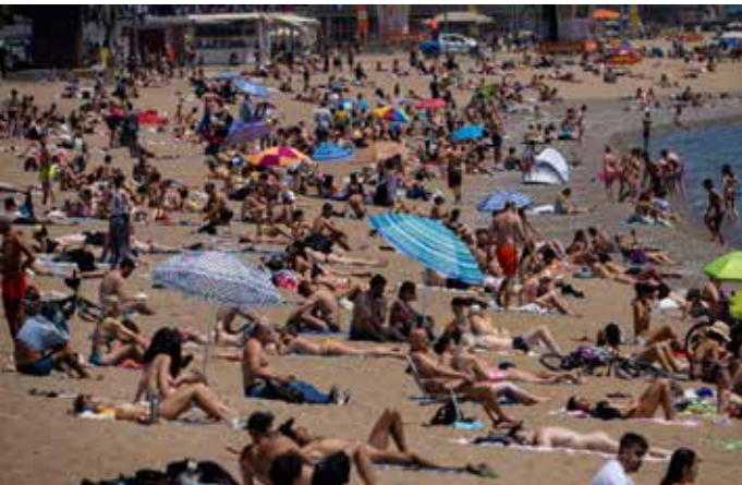
Du khách đổ xô đến các bãi biển ở Barcelona, Tây Ban Nha vào ngày 8-6-2021

Với sự “bảo hộ” của vắc xin, nền du lịch châu Âu mùa hè này mang đầy ắp hi vọng phục hồi sau hơn một năm trì trệ bởi “bóng ma” covid-19.