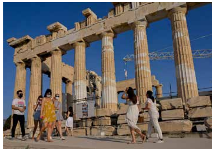
Du khách tại đền thờ Parthenon trên đồi Acropolis ở Athens, Hy Lạp vào ngày 8-6-2021

Các quốc gia châu Âu trước hết triển khai hộ chiếu vắc xin với du khách Mỹ bởi 2 lí do. Trước hết, vì 60-70% dân số trưởng thành ở Mỹ đã được tiêm vắc xin, trong khi đa số các nước trên thế giới chỉ ở mức vài %. Thứ hai, Mỹ là thị trường cổ đóng góp rất lớn đối với du lịch châu Âu. Theo thống kê, trước đại dịch, du khách từ Mỹ và Anh chiếm đến 30% của tổng số gần 65 triệu du khách đến Italia mỗi năm. Trong khi đó, tại Tây Ban Nha, Hy Lạp, Bồ Đào Nha... Mỹ và Anh cũng là lượng du khách đông nhất, chi tiền nhiều nhất, bên cạnh du khách Trung Quốc và Trung Đông.